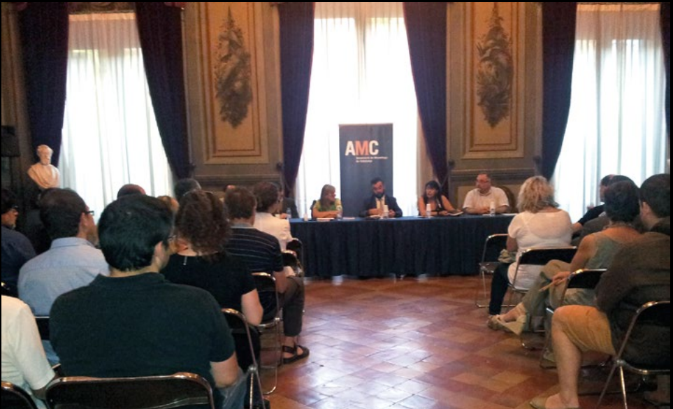
Presentació del 1er Manual de Museologia, La il·luminació als museus , al Palau Moja de Barcelona, el 18/7/2012 (MI BT).