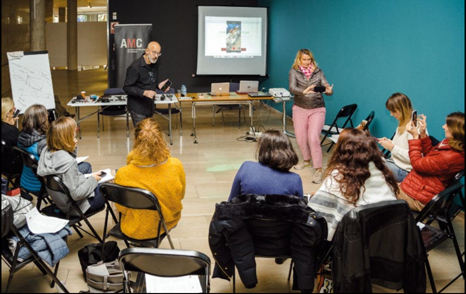
Taller de Museologia: Videografia amb mòbil per a museus, al Museu Abelló de Mollet, el 16/11/2019 (AMC).