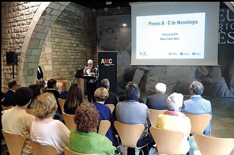
Entrega de la 7a edició dels Premis AMC de Museologia al Museu Marés de Barcelona, el 15/6/2018 (LRF).