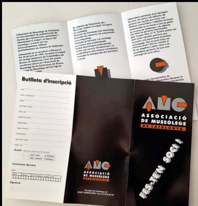
El primer tríptic de l'AMC amb la butlleta per fer-se soci l'any 1996 (XMP).