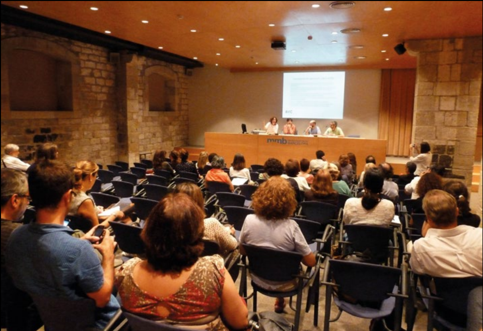
XXIII Assemblea ordinària al Museu Marítim de Barcelona, el 30/4/2019 (AMC).