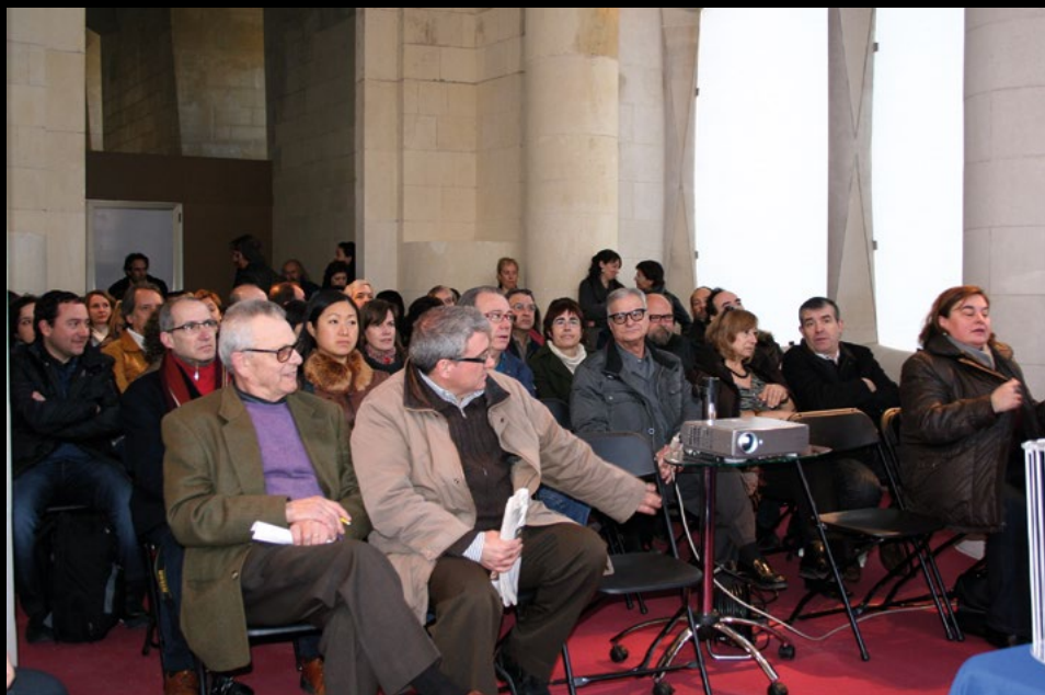
XV Assemblea ordinària de l'AMC a la Sagrada Família de Barcelona, el 5/3/2011 (MJBT).