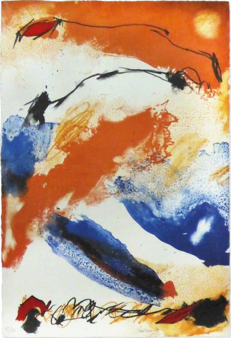
Diploma dels Premis AMC de Museologia Josep Guinovart. Litografia (2004) Núm. 45/50