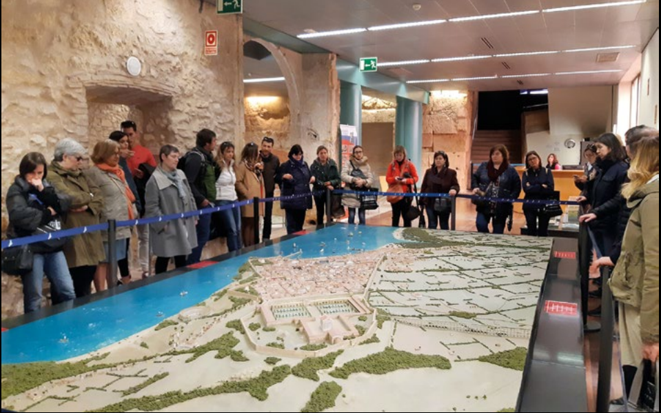
Visita tècnica al patrimoni mundial de Tàrraco, el 6/4/2019 (XMP).