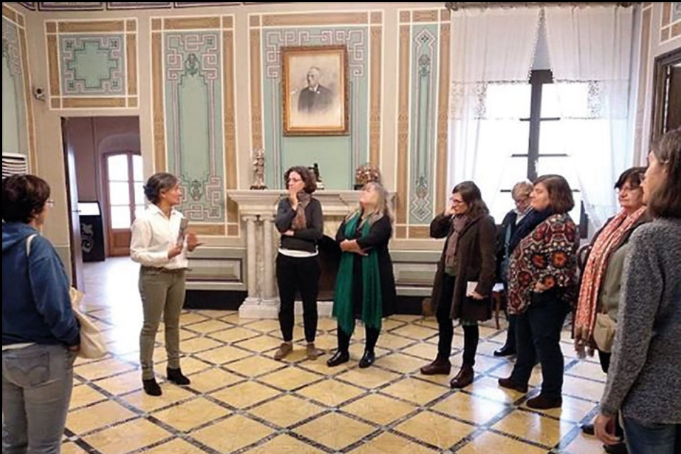
Visita tècnica al Museu d'Alcover, el 27/10/2018 (AMC).