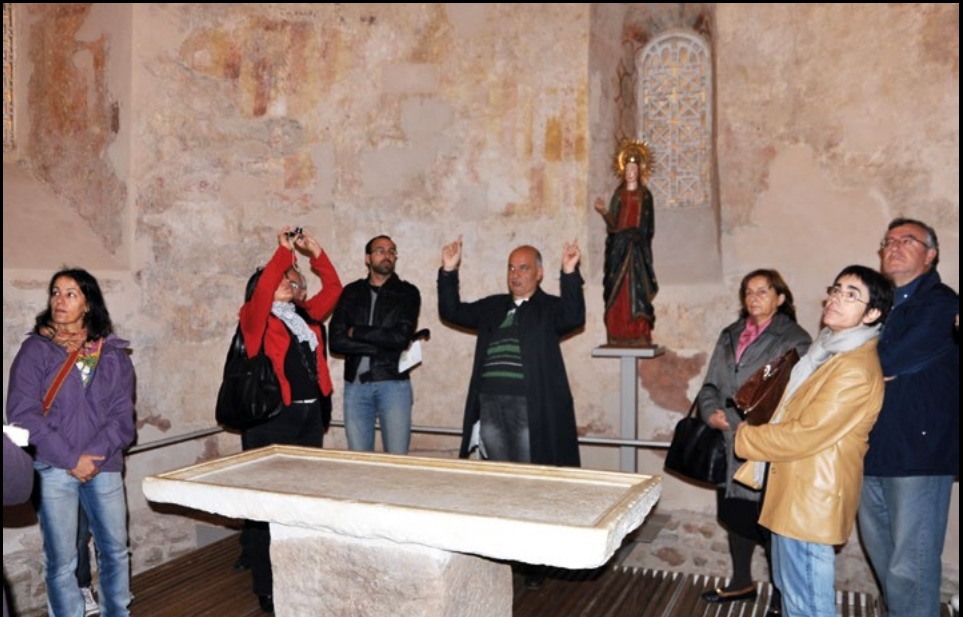
Visita al conjunt monumental de la Seu d'Egara a Terrassa, el 5/11/2011 (AMC).