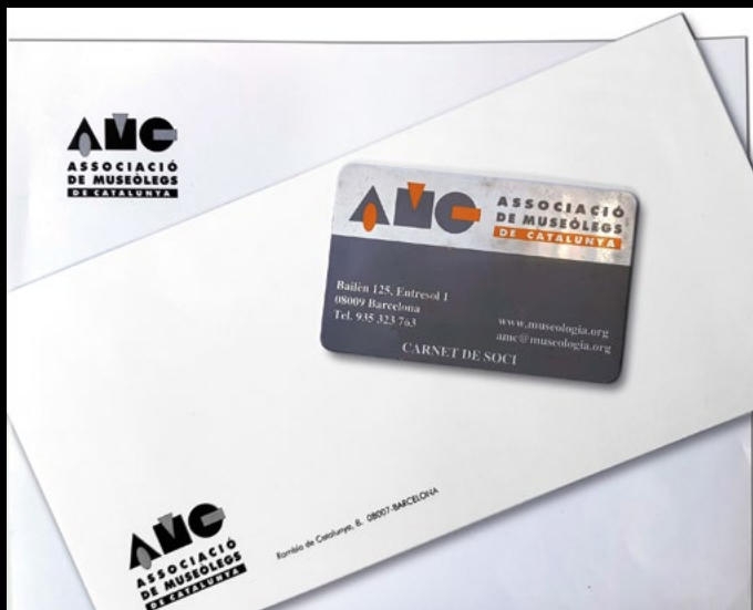
El primer logotip i carnet de l'AMC, l'any 1996 (XMP).