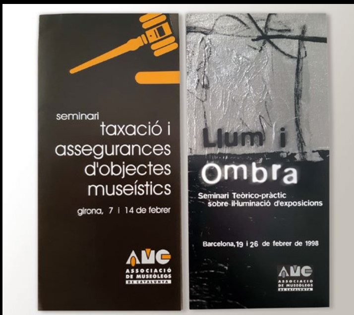
Els programes dels dos primers seminaris de l'AMC, 1997 i 1998 (XMP).