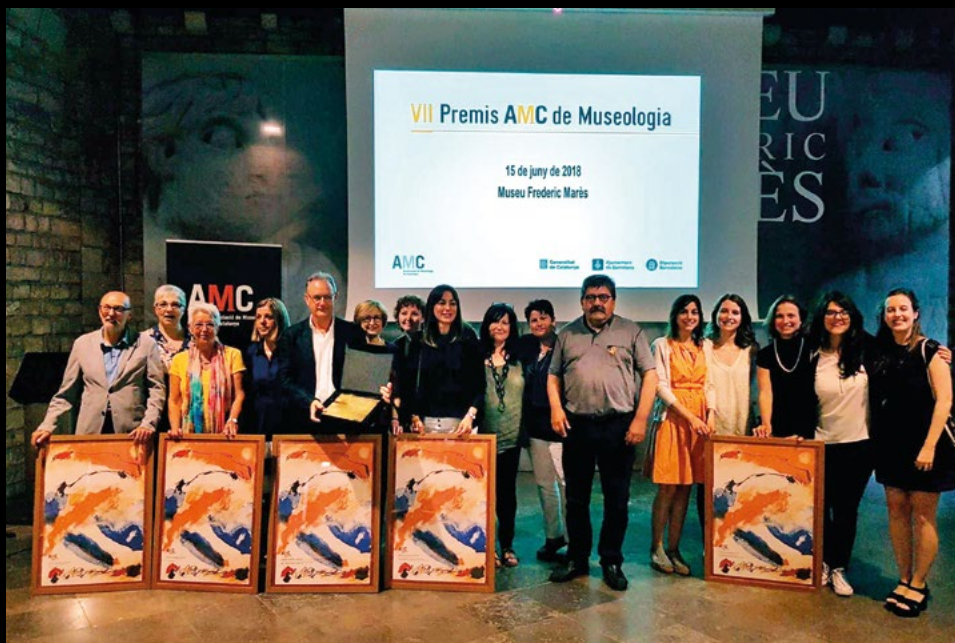
Entrega de la 7a edició dels Premis AMC de Museologia al Museu Marés de Barcelona, el 15/6/2018 (MPA).