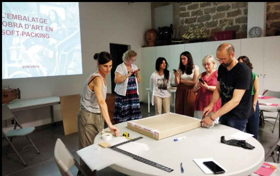
Taller de Museologia: Embalatge d'objectes en 'softpacking' , al Museu Marítim de Barcelona, el 29/6/2019 (AMC).