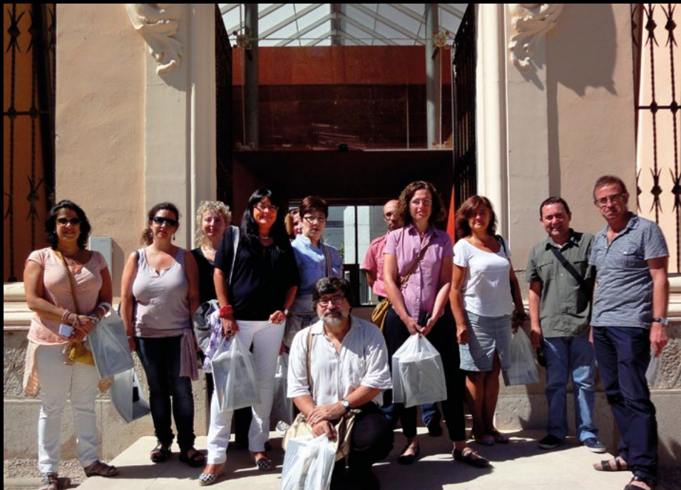
Visita al Museu de les Terres de l'Ebre a Amposta, el 15/9/2012 (AMC).