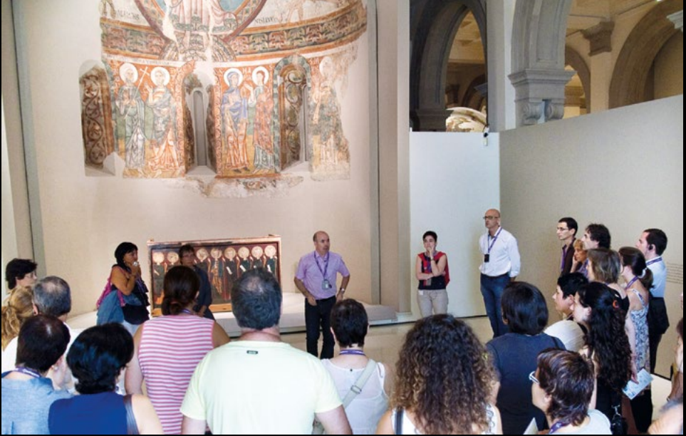
Visita a les sales d'art romànic al MNAC de Barcelona, el 17 de setembre de 2011, amb motiu de la remodelació que havia estat inaugurada feia pocs mesos (AMC).