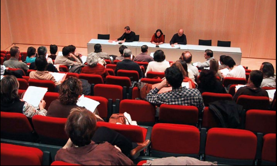
IX Assemblea ordinària celebrada al CosmoCaixa de Barcelona, l'11/12/2004 (MPA).