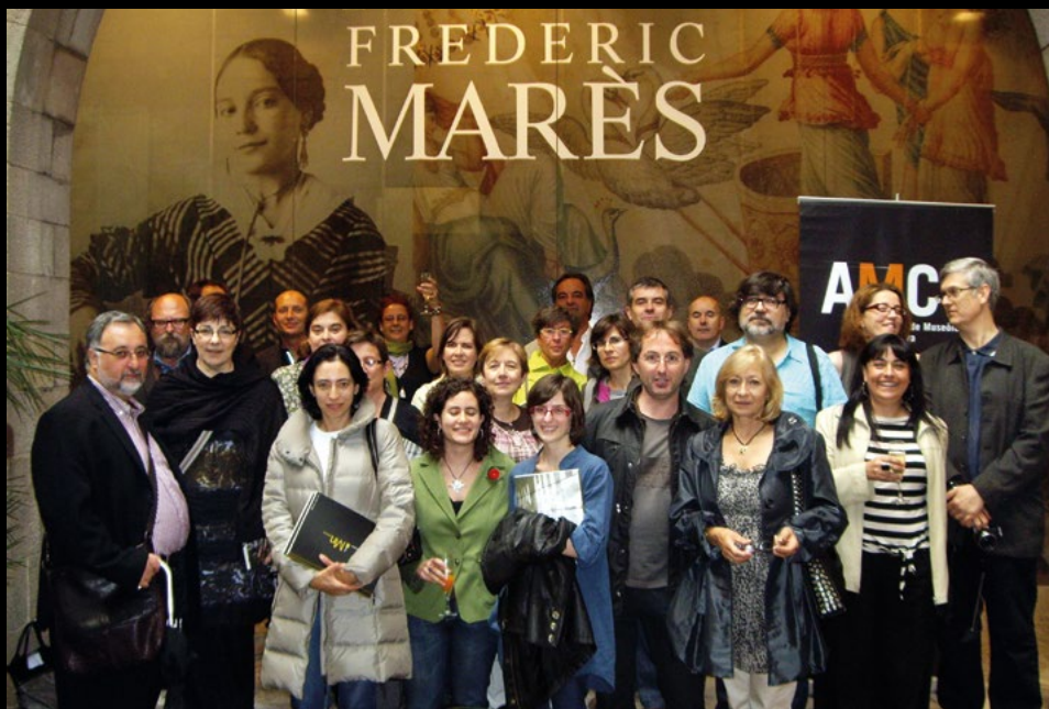
Presentació del número 6 de la revista Mnèmòsine al Museu Marès de Barcelona, el 2/6/2011 (MJBT).