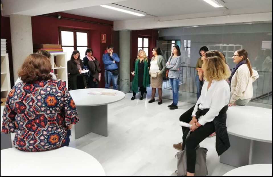
Visita tècnica al Museu d'Alcover, el 27/10/2018 (LRF).