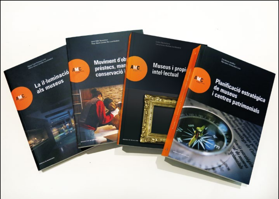
Els Manuals de Museologia de l'AMC (ANC).