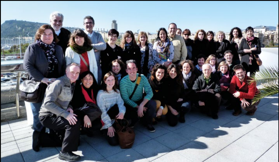
Taller de Museologia: Les xarxes socials. Apropar museus i públics social-media , al Museu d'Història de Catalunya, el 22/2/2014 (DSL).