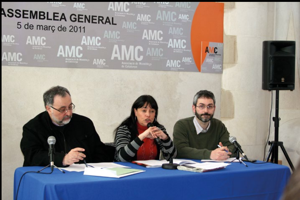
XV Assemblea ordinària de l'AMC a la Sagrada Família de Barcelona, el 5/3/2011 (MIJT).