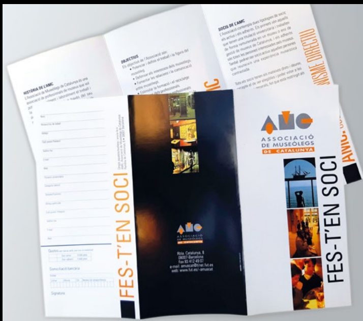
El tríptic informatiu de l'AMC amb el nou logotip de principis dels anys 2000 (XMP).