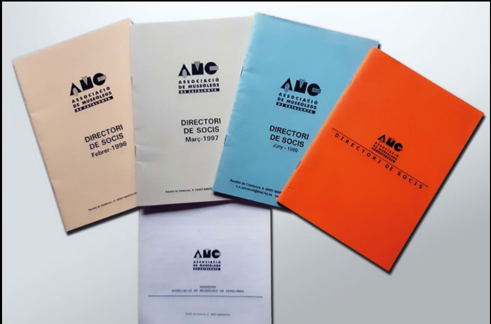
Els primers directoris de l'AMC editats en paper (XMP).