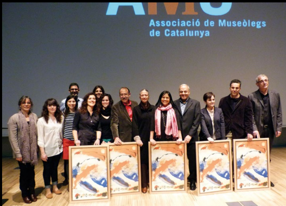
Entrega de la 5a edició dels Premis AMC de Museologia al Museu del Disseny de Barcelona, el 27/3/2014 (DSL).