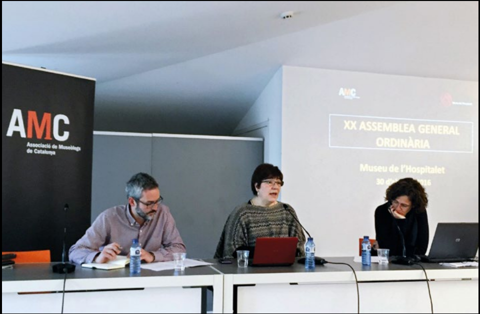
XX Assemblea ordinària al Museu de l'Hospitalet, el 30/4/2016 (AMC).