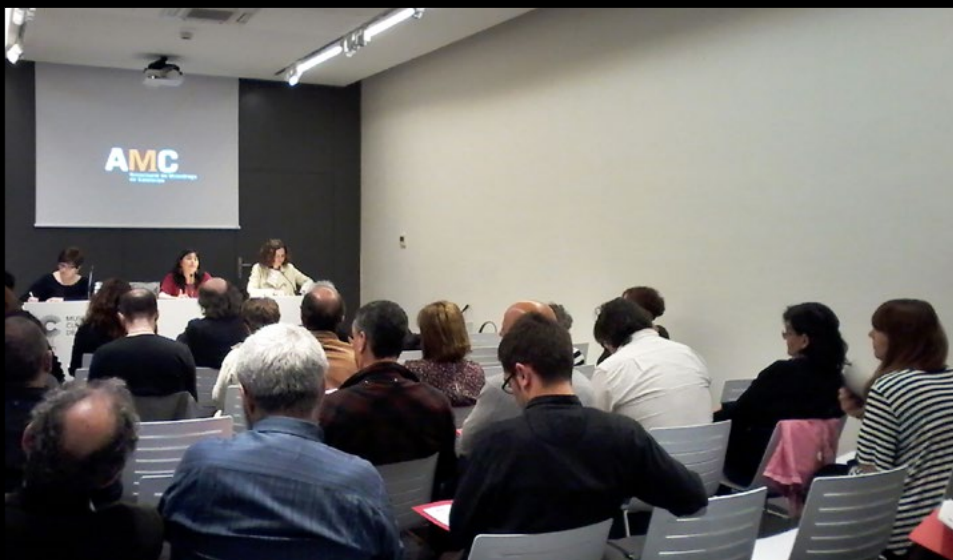
XIX Assemblea ordinària al Museu de Cultures del Món de Barcelona, el 18/4/2015 (MPA).