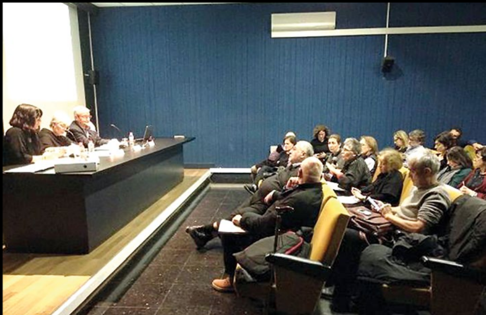
Jornada de debat sobre els perfils professionals als museus al Museu d'Arqueologia de Catalunya a Barcelona, el 27/11/2018 (AMC).