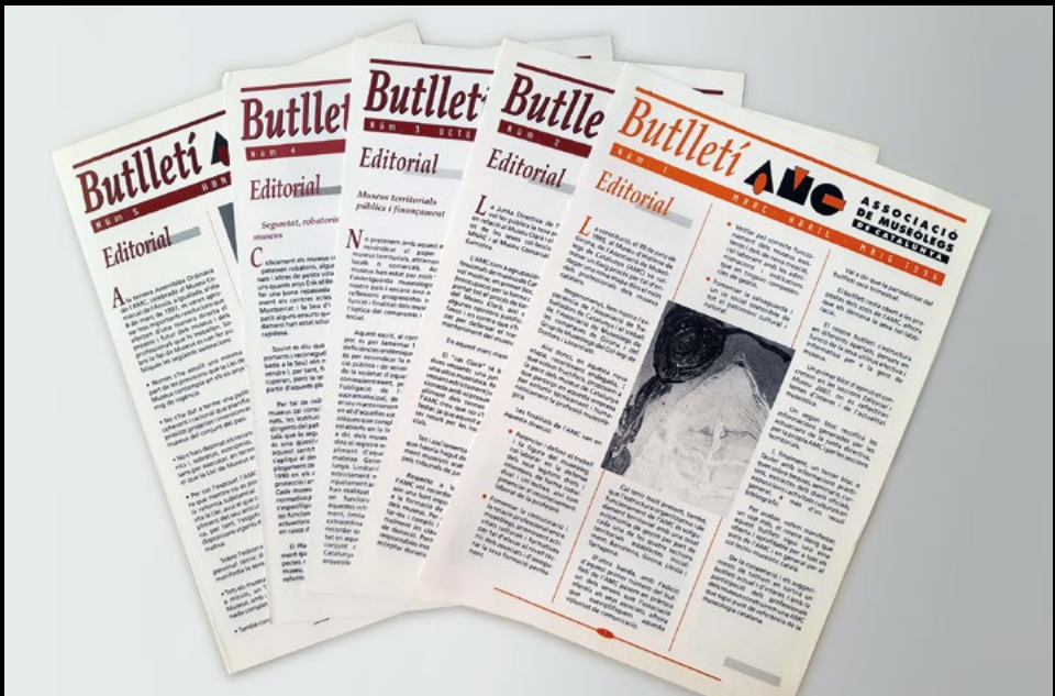
El Butlletí AMC editat entre 1996 i 1997 (XMP).