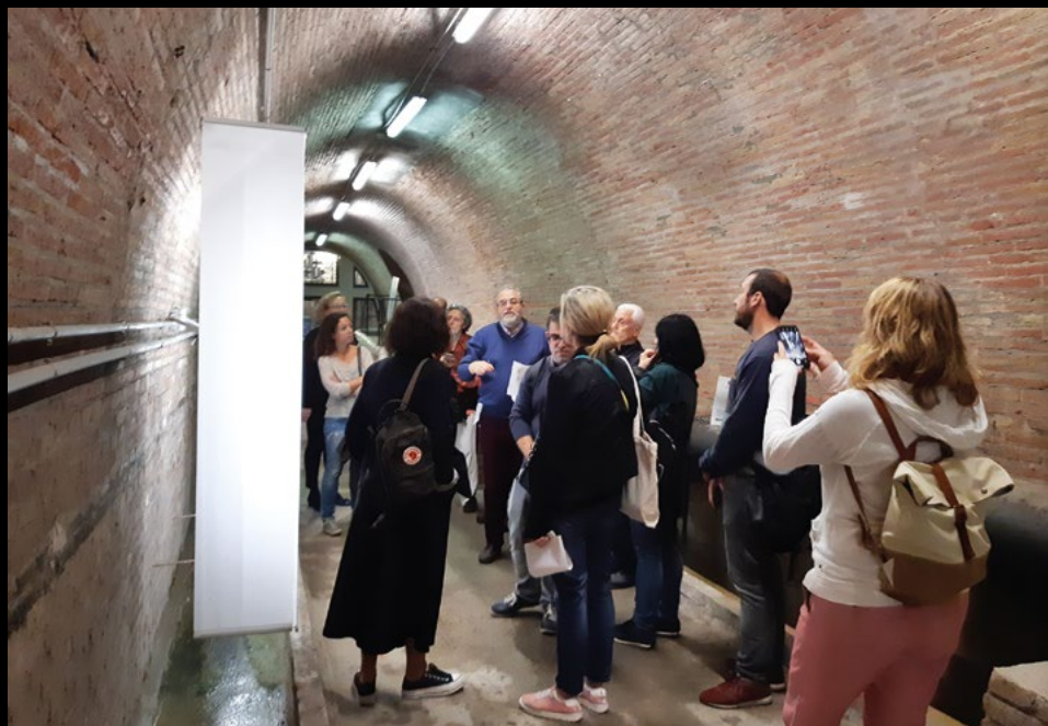
Visita a la Casa de l'Aigua a la Trinitat de Barcelona, espai patrimonial del MUHBA, el 28/10/2019 (XMP).