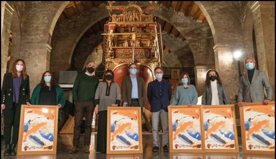
Entrega de la 8a edició dels Premis AMC de Museologia al Museu Marítim de Barcelona, el 3/12/2020 (AMC).