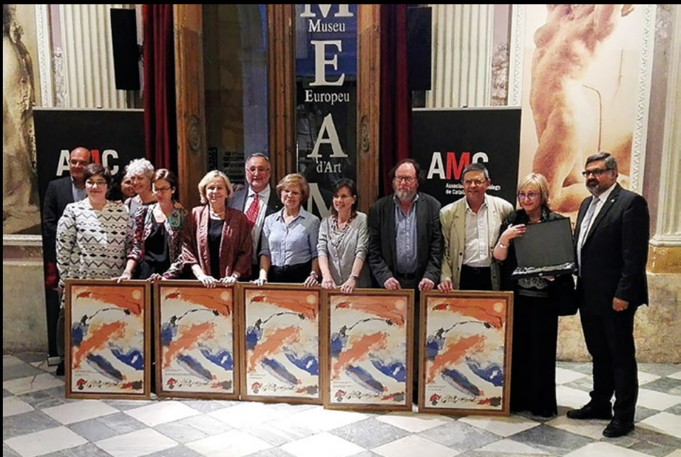
Entrega de la 6a edició dels Premis AMC de Museologia al Museu Europeu d'Art Modern de Barcelona (MEAM), el 17/6/2016 (AMC).