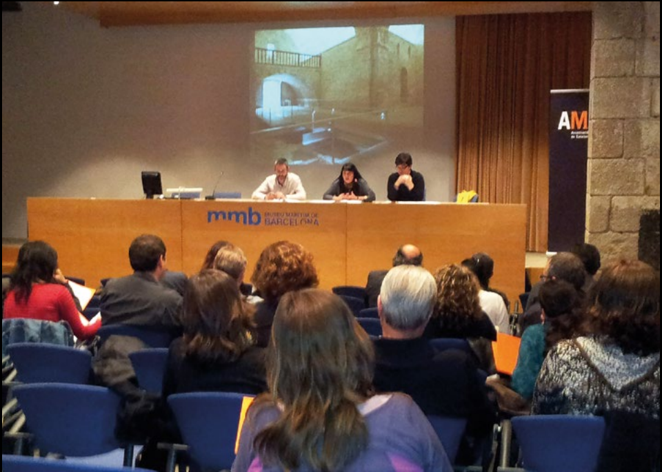
XVI Assemblée ordinària celebrada al Museu Marítim de Barcelona, el 26/4/2012 (MI BT).