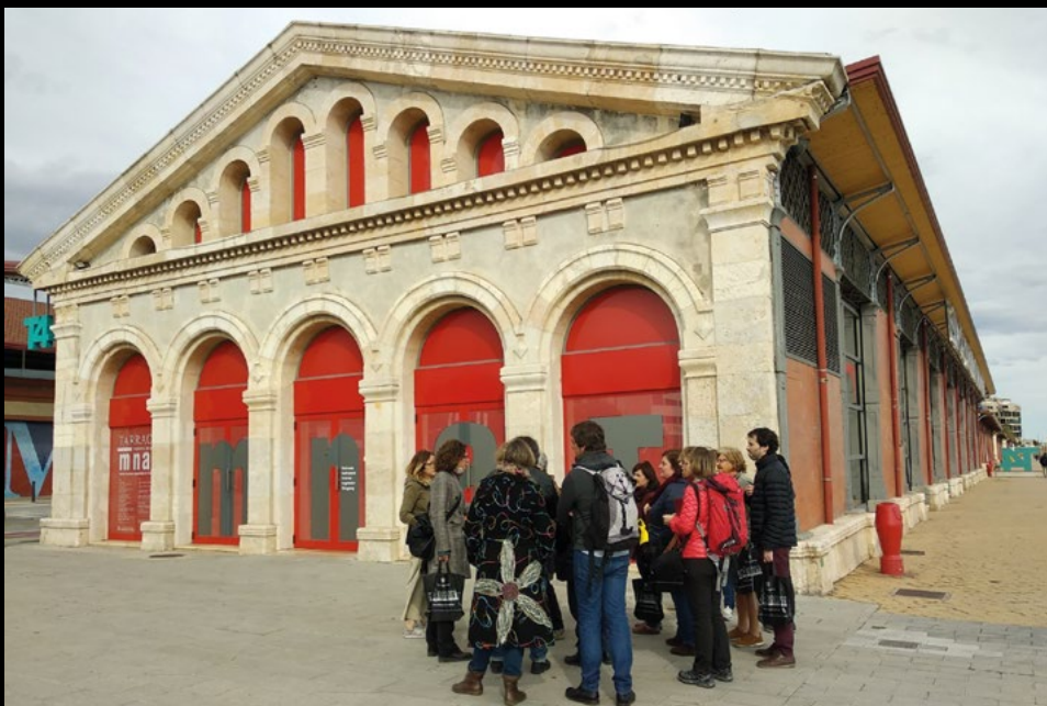
Visita tècnica al patrimoni mundial de Tàrraco, el 6/4/2019 (AMC).