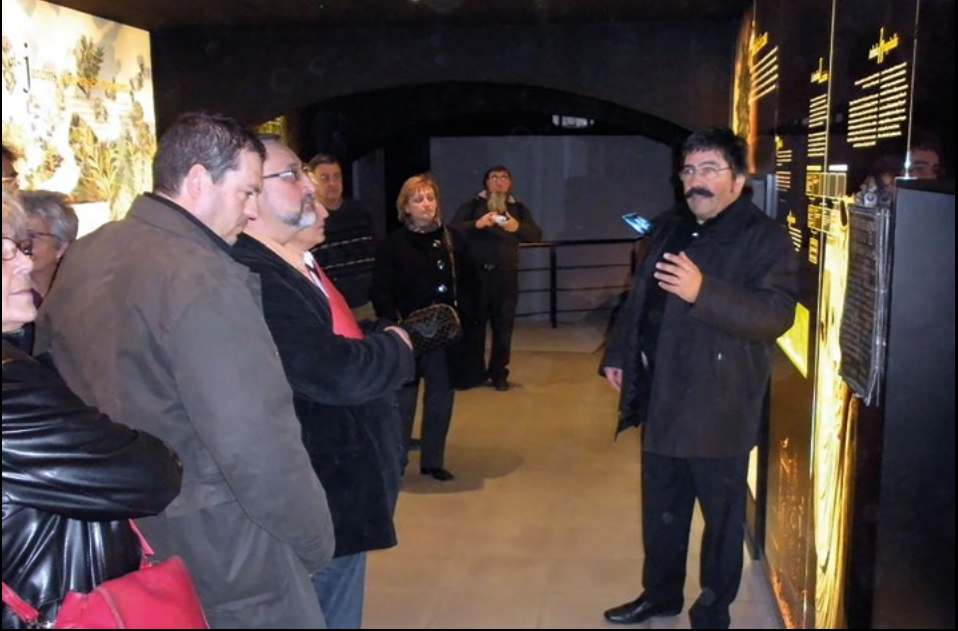
Visita al Museu de Badalona coincidint amb la XIII Assemblea ordinària de l'AMC, el 28/2/2009 (MIJT).