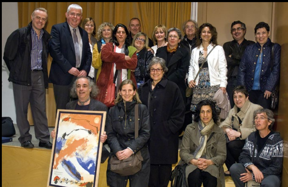
Entrega de la 4a edició dels Premis AMC de Museologia al Museu Marítim de Barcelona, el 23/3/2012. El personal del Museu d'Història de Catalunya amb el premi Experiències pel Projecte Tombes Reials de Santes Creus (AMC).