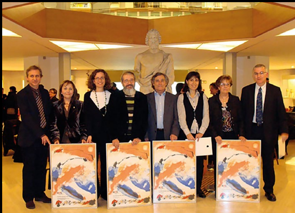
Entrega de la 2a edició dels Premis AMC de Museologia al Museu d'Arqueologia de Catalunya a Barcelona, el 15/2/2008 (MI BT).