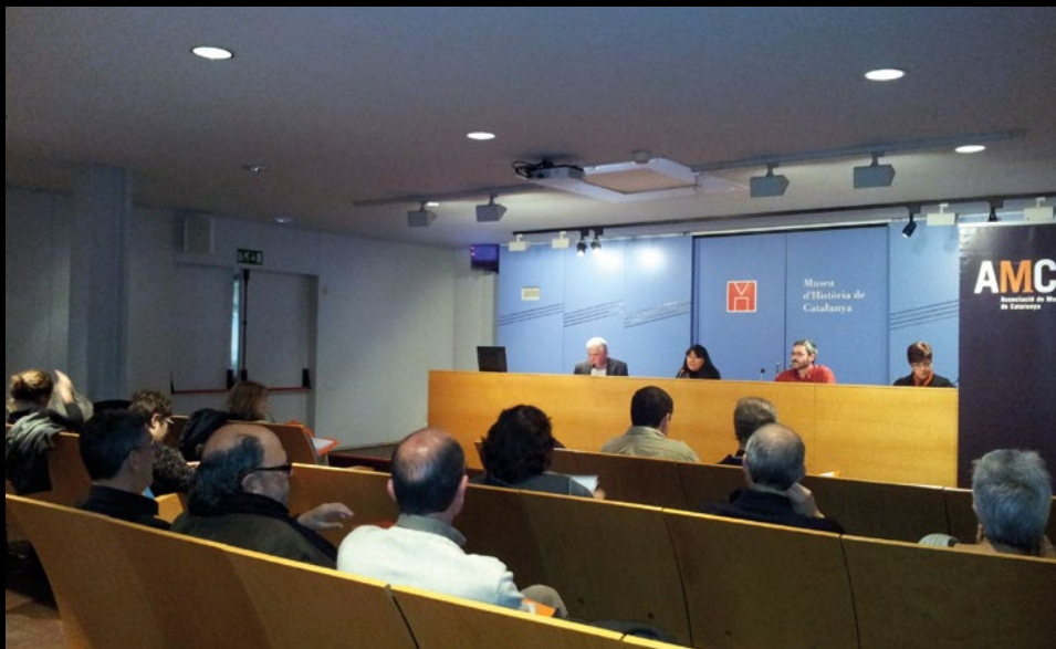
Assemblea extraordinària per a la reforma dels estatuts al Museu d'Història de Catalunya, el 15/12/2012 (MI BT).