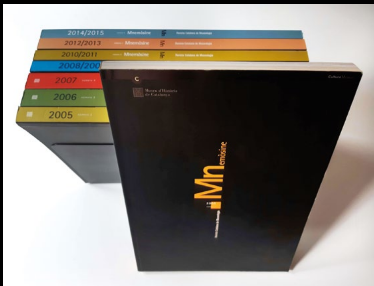
Mnemòsine, Revista catalana de Museologia (XMP).