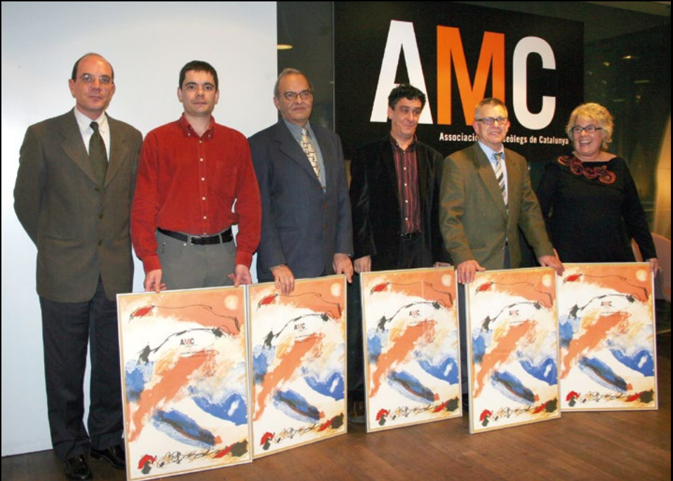
Entrega de la 1a edició dels Premis AMC de Museologia al Museu d'Història de Catalunya a Barcelona, el 22/12/2005 (AMC).